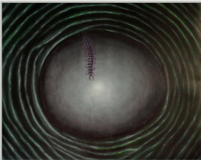
Indiferencia , óleo sobre papel Fabriano