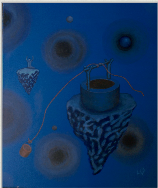
El día es una idea ambiental , óleo sobre tela Ángel Carlos Sánchez