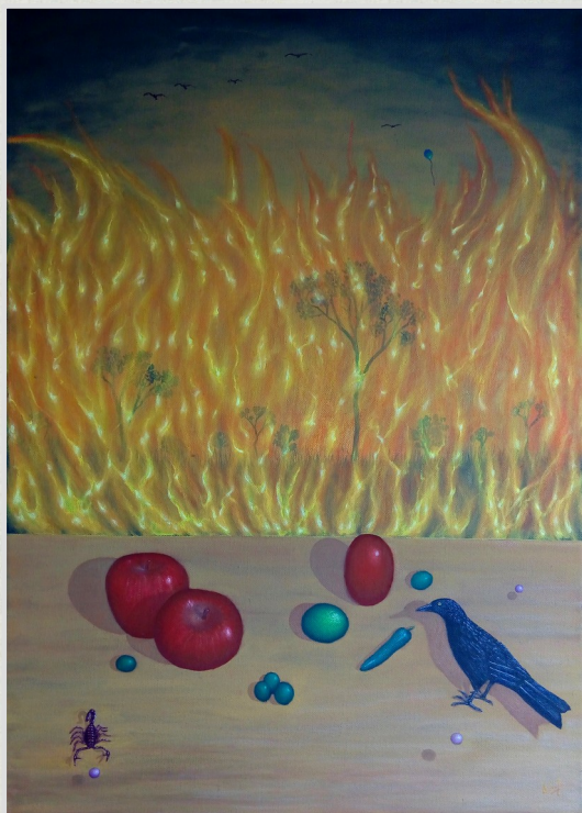
Arde la inocencia, óleo sobre tela