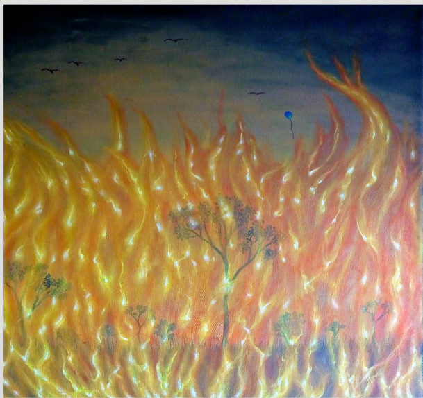
Arde la inocencia (fragmento) , óleo sobre tela