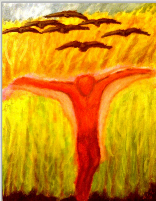
Algo se acerca , óleo sobre tela