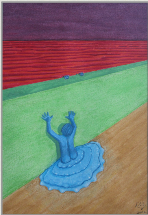
Algo, alguien , acuarela y lápiz de color